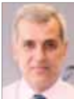
Του Στέφανου Κотζιανή

Ακόμη πιο εντυπωσιακό είναι πως οι αποδόσεις των περισσότερων μετοχών έχουν ξεπεράσει κατά πολύ το επίπεδο του Γενικού Δείκτη, εξ' αιτίας του ότι ένας σημαν-