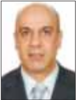
Του Μιχάλη Κρονίδη

Α πό τα μέσα του 2012 βρίσκεται σε εξέλιξη μια έντονη προσπάθεια να περιοριστεί ο βαθμός αλληλεξάρτησης των κρατών με τα χρηματοπιστωτικά ιδρύματα και αντίστροφα. Το φαινόμενο της αλληλεξάρτησης, λόγω των οικονομικών συνθηκών, είναι ιδιαίτερα έντονο στα κράτη που αποτελούν την περιφέρεια της ευρωζώνης. Ο κίνδυνος που προκύπτει από το βαθμό αλληλεξάρτησης είναι διττός. Για το κράτος, ο κίνδυνος προκύπτει από την ανάληψη δυναμικής ευθύνης για στήριξη του εθνικού τραπεζικού συστήματος, κάτι που επιφέρει οικονομικό κόστος σε περίπτωση που καταστεί αναγκαία