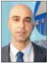
Του Δρα Γιώργου Θεοχαρίδη

Η πρώτη από τις τραπεζικές μεταρρυθμίσεις που επιβάλλεται από την Τρόικα είναι η απαίτηση για καλύτερη ρευστότητα στο τραπεζικό σύστημα με την επιβολή ορίων συγκέντρωσης του 25% των εποπτικών ιδίων κεφαλαίων και στο 50% για το εγχώριο δημόσιο χρέος, επενδύοντας τουλάχιστον κατά 50% της απαιτούμενης ρευστότητας σε τίτλους που είναι ασφαλείς και ρευστοποιήσιμοι (δηλαδή σε τίτλους της χρηματαγοράς μικρής διάρκειας), και με ελά-