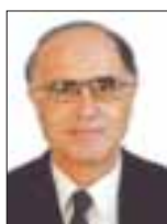
Του Ανδρέα Θ. Ασισιώτη

Μ ε την οικονομική κρίση επήλθε για πολλούς συμπολίτες μας ιδιαίτερα τους ανέργους, τις μονογονικές οικογένειες και την πλειοψηφία των συνταξιούχων ραγδαία επιδείνωση των εισοδημάτων τους. Αναμένουμε από το νέο Πρόεδρο τη δημιουργία και χάραξη διαφορετικής πορείας με σκοπό να εξέλθουμε με το λιγότερο οικονομικό και κοινωνικό κόστος από την πολλαπλή κρίση που ταλανίζει τον τόπο. Εάν δεν αποκατασταθεί η εμπιστοσύνη του λαού στο