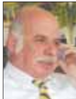
Του Ουράνιου Ιωαννίδη

Πριν 4 χρόνια η χώρα του η Ισλανδία αντιμετώπισε το πρόβλημα της χρεοκοπίας των τραπεζών. Ο κύριος Grimsson αντιμετώπισε το πρόβλημα της κατάρρευσης των τραπεζών ως ένα πρόβλημα ιδιωτικών επιχειρήσεων που απέτυχαν να διαχειριστούν τον πλούτο τους.