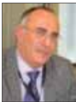
Του Νώντα Μεταξά

Προτείνονται συνεπώς στην κατεύθυνση αυτή, μεταξύ άλλων, οι ακόλουθες εισηγήσεις: