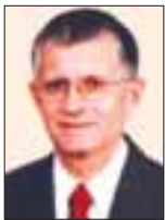
Του Νίκου Σύκα

είναι οι αντιστοιχίες μεταξύ εννοιακών πεδίων – ο συσχετισμός και η εφαρμογή ενός πεδίου γνώσης σε κάποιο άλλο πεδίο προσφέρει νέες οπτικές αντίληψης και κατανόησης.