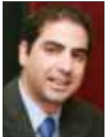
Του Δρα Αντώνη Στ. Στυλιανού

Η ολόενα και αυξητική τάση χρήσης του όρου «κρίση» διατυπώνει την αναγκαιότητα διευκρίνησης των αναφορών στην κρίση. Αναμφίβολα, ο όρος αναφέρεται, μεταξύ