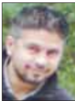
Του Δημήτρη Βαρζακάκου

Τί είναι όμως το ISO 9001 και πώς μπορεί να βοηθήσει μία επιχείρηση ειδικότερα στις δύσκολες αυτές μέρες;