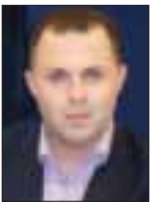
Του Δημήτρη Ιωαννίδη

Γνωρίζετε ότι αν οι χρήστες του facebook ζούσαν όλοι μαζί σε μία χώρα, αυτή θα ήταν η τρίτη μεγαλύτερη σε πληθυσμό στον κόσμο, μετά την Κίνα και την Ινδία; Εάν όχι, τότε τώρα το γνωρίζετε! Μεταξύ άλλων, αυτό που κάνει τα μέσα κοινωνικής δικτύωσης τόσο ισχυρά, είναι η ικανότητά τους να ενισχύουν τις επιδράσεις οποιασδήποτε –θετικής ή αρνητικής, ηθελημένης ή μη– καμπάνιας από «στόμα σε στόμα». Αυτό, τα στελέχη του μάρκετινγκ των επιχειρήσεων το γνωρίζουν πλέον πολύ καλά, ωστόσο, η συντριπτική τους πλειοψηφία μάλλον δεν ξέρει πώς μπορεί να εκμεταλλευτεί αυτή τη δύναμη των μέσων κοινωνικής δικτύωσης.