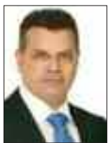
Του Νίκου Νουρή

Σ τον επιστημονικό κόσμο είναι διαχρονικά καλά γνωστές τόσο οι ιαματικές όσο και οι επιβλαβείς επιδράσεις του φυσικού φωτός στον ανθρώπινο οργανισμό. Η χώρα μας ευρίσκεται σε μια κατ' εξοχή ηλιόλουστη περιοχή του πλανήτη με μεγάλες περιόδους αιθριότητας, γεγονός που μεγιστοποιεί την ετήσια ηλιοφάνεια της. Η ηλιοφάνεια ευθύνεται σε μεγάλο βαθμό για την ευεξία των ανθρώπων, γι' αυτό και στις χώρες όπου αυτή απουσιάζει, παρατηρούνται