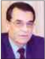
Του Δρα Χριστόδουλου Χριστόδουλου

καμιά σχεδόν άλλη χώρα, τα ουσιαστικά και τυπικά κριτήρια της Συνθήκης του Μάαστριχτ. Τότε που είχαμε τους καλύτερους μακροοικονομικούς δείκτες μετά το Λουξεμβούργο. Ήταν ακριβώς τότε που απέδωσε η σωστή οικονομική πολιτική, η άψογη συνεργασία μεταξύ Εκτελεστικής Εξουσίας και Κεντρικής Τράπεζας και η συλλογική κοινωνική προ-