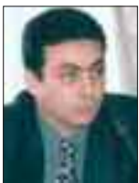
Του Χρήστου Ιακώβου

Τ ο 609 μ.χ. ο έξαρχος Ηράκλειος απέπλευσε με ισχυρές στρατιωτικές δυνάμεις από την Καρχηδόνα με προορισμό την Κωνσταντινούπολη για να ανατρέψει τον σφετεριστή και επικίνδυνο αυτοκράτορα Φωκά. Οι χρονικογράφοι της εποχής περιγράφουν το Φωκά ως άσχημο στην όψη και ακόμη χειρότερο στη διοίκηση. Κτηνώδης, αδίστακτος και ανίκανος, επέτρεψε στους εχθρούς να διεισδύσουν στην αυτοκρατορία και εισήγαγε απηνείς διωγμούς και μεθόδους ανελέητων βασανισμών εναντίον των πολικών του αντιπάλων, όπως η τύφλωση και ο ακρωτηριασμός.