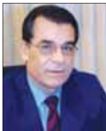
Του Δρα Χριστόδουλου Χριστοδούλου

Η κυπριακή οικονομία διέρχεται, εδώ και τέσσερα χρόνια, μια κρίση διάρκειας. Στην πραγματικότητα τελεί σε κατάσταση παρατεταμένης ύφεσης με αυξομειωτικές τάσεις, που δεν διαφοροποιούν το αρνητικό επακόλουθο και τις δυσμενείς του συνέπειες. Το Ακαθάριστο Εγχώριο Προϊόν ετησίως μειώνεται σταθερά, η αγοραστική δυνατότητα των πολιτών εξασθενεί, αφού οι απολαβές σε πραγματικούς όρους μειώνονται, η ανεργία αυξάνεται, όπως και πληθωρισμός, ενώ οι πρόσθετες φορολογίες και οι έκτακτες περικοπές μισθών, ημερομισθίων και συντάξεων δίνουν το αλάθητο μέτρο στάθμισης της οικονομικής κυ-