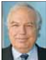
Του Θεόδωρου Παναγιώτου*

ασφάλιστρο κινδύνου. Και οι μόνες δαπάνες που θα το δι- καιολογούσαν μια τέτοια κί- νηση θα ήταν επενδύσεις με- γάλης απόδοσης, όπως η ερ- γοδότηση των νέων που απαξιώνονται καθημερι- νώς για δύο και πλέον χρό- νια και η προώθηση καινοτο- μικών επιχειρήσεων για να