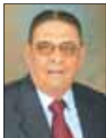
Του Δημήτρη Εργατούδη

Ο Δρ. Laurence J. Peter γεννήθηκε το 1919 στο Βανκούβερ του Καναδά και άρχισε την καριέρα του το 1941 ως δάσκαλος. Το 1963 απέκτησε διδακτορικό στην