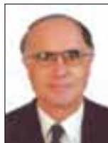
Του Ανδρέα Θ. Ασσιώτη

διαφθοράς, την υπερμεγέθη παράνομη μετανάστευση, με συνεπακόλουθο την αλλοίωση του δημογραφικού χαρακτήρα της χώρας, τη συνεχώς αυξανόμενη ανεργία και τα ανεξέλεγκτα πλέον δημοσιονομικά ελλείμματα, μαζί με τις απαιτήσεις των δανειστών μας, προβάλλουν ως ανυ-