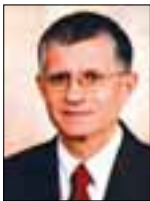
Του Νίκου Γ. Σούκα

Σ ύμφωνα με τα τελευταία στοιχεία του νέου Παγκόσμιου Δείκτη Κατανάλωσης της PwC, η αύξηση στις παγκόσμιες καταναλωτικές δαπάνες καταγράφει ύφεση, ωστόσο, η ύφεση αυτή εμφανίζεται μάλλον μειωμένη τον Οκτώβριο 2012. Η εν λόγω εξέλιξη ενδέχεται να οδηγήσει σε σταδιακή ανάκαμψη το 2013. Ο Δείκτης αντικατοπτρίζει μια σημαντική καταγραφή των τάσεων του παγκό-