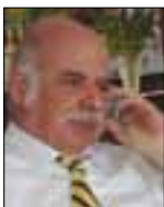
Του Ουράνιου Ιωαννίδη

Η τρόικα όμως δεν είναι φιλανθρωπικό ίδρυμα, είναι απλά και μόνον δανειστής που θέλει να πάρει πίσω τα λεφτά που θα μας δώσει. Εμείς όμως ζητούμε ναβάλουμε τους δικούς μας όρους για το πώς θέλουμε να είναι το υπό εκκώλυση